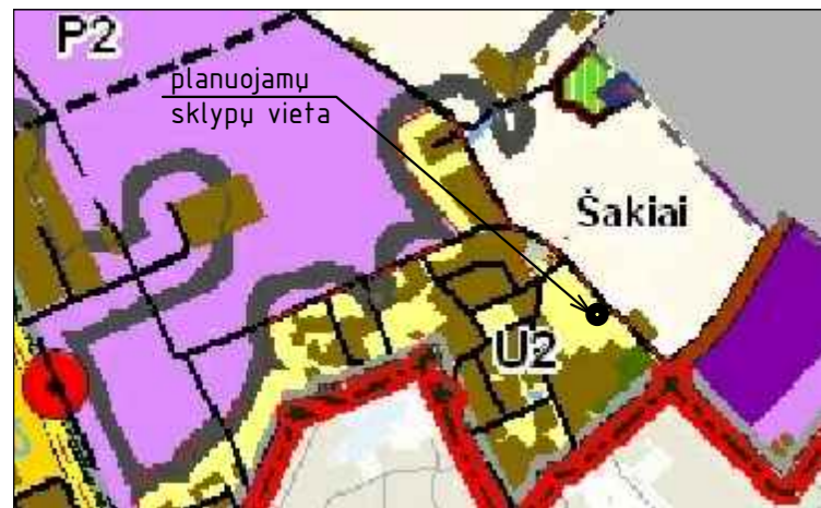
IŠTRAUKA IŠ KAUNO R.SAV. TERITORIJOS BENDROJO PLANO I-ojo PAKEITIMO