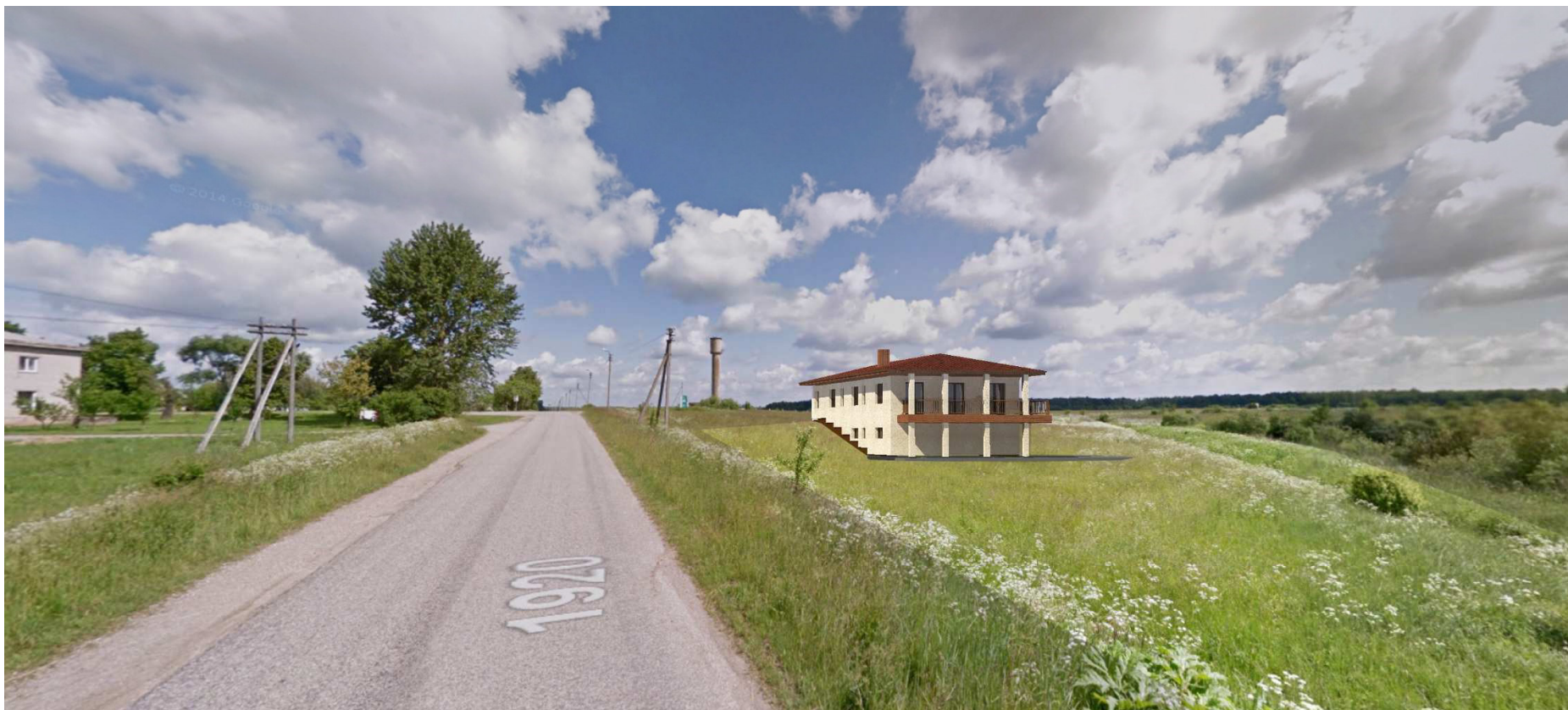
VIZUALIZACIJA NUO BOKŠTO GATVĖS