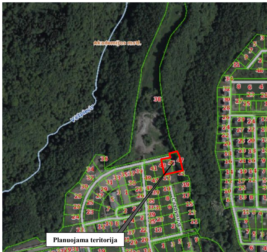
1 pav. Situacijos schema

Planuojama teritorija apima šiuos sklypus: