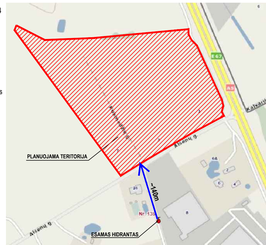
GAISRŲ GESINIMO SCHEMA