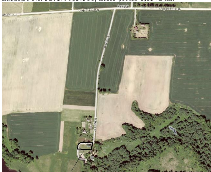
Planuojamos teritorijos išsidėstymo vieta

Planuojamą teritoriją apima įregistruotas sklypas Kauno r. sav., Rokų sen., Pavytės k., Dujotiekio g. 52, kadastro Nr. 5273/0013:388, kurio plotas 0,1572 ha.