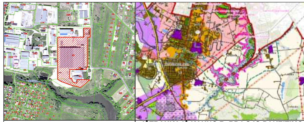
SITUACIJOS SCHEMA IŠTRAUKA IŠ KAUNO R. BP I-OJO PAKAITIMO